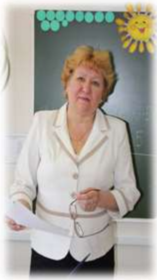
Святыня Г. М.