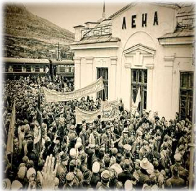
Встреча первых строителей БАМа 2 мая 1974 год