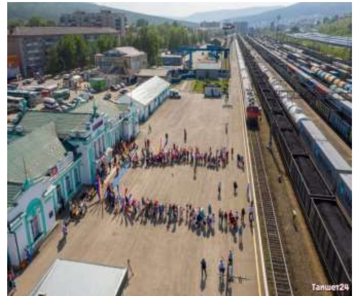
2 мая 2019 год