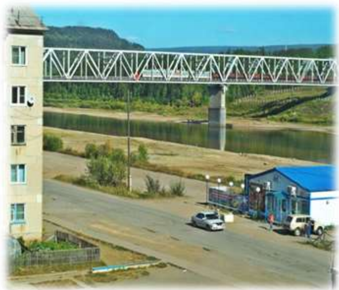
«Ворота БАМа» МО №5