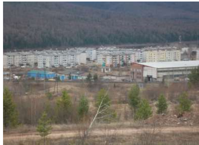
Жилье для бамовцев МО №102